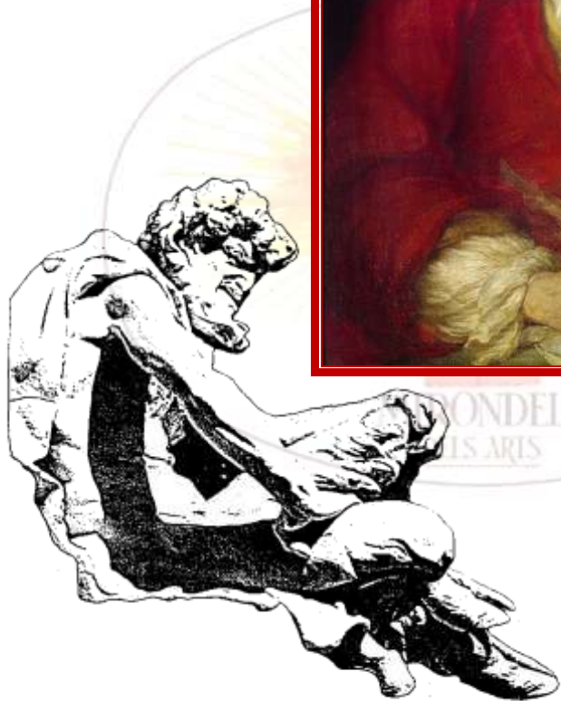
MOLIÈRE (Jean-Baptiste Poquelin, dit) 1622-1673